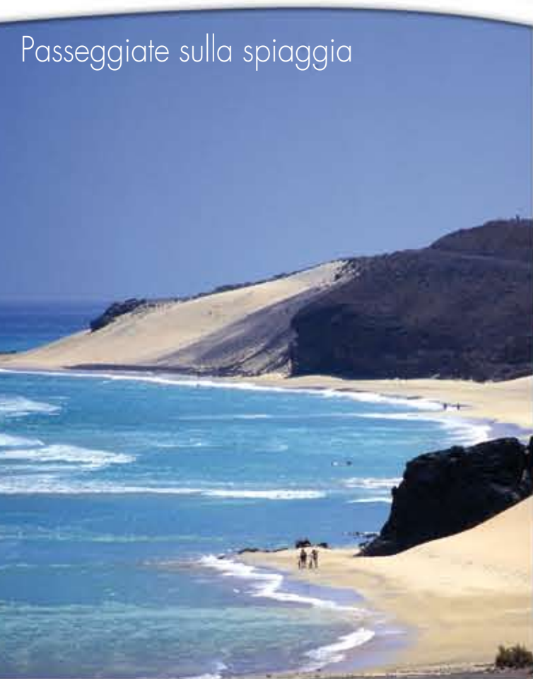
Passeggiate sulla spiaggia

Oltre al celebre Campionato del Mondo di Windsurf e Kiteboarding che si celebra da 26 anni nel sud dell'isola, sono presenti eventi pensati per gli amanti del ciclismo, come la corsa Fudenas, che attraversa l'isola da nord a sud, o per gli amanti del trekking e delle passeggiate, come la Media Maratón Dunas di Corralejo, che percorre le dune di sabbia del nord dell'isola, o il Raid Jable Pájara - Spiagge di Jandía, i cui partecipanti camminano in lungo e in largo sulle superbe spiagge e tra i paesaggi del Parco Naturale di Jandía. Eventi eterogenei con un denominatore comune: la perfetta combinazione tra godersi la natura e praticare sport.