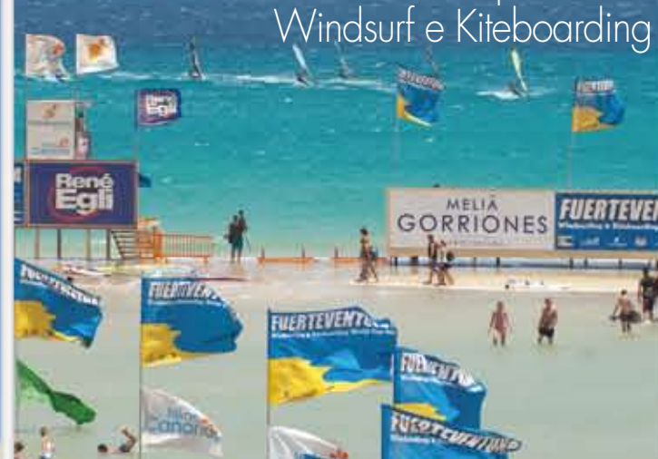
Campionato di Windsurf e Kiteboarding