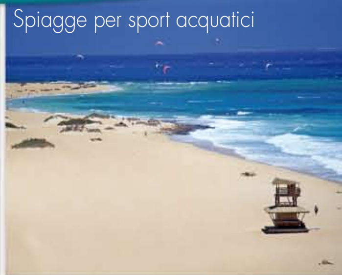
Spiagge per sport acquatici