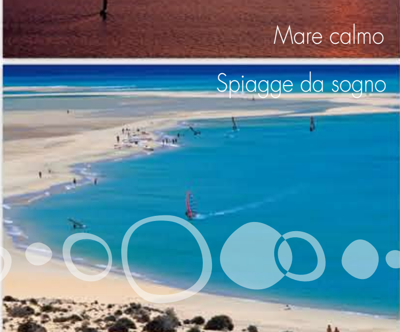
Spiagge da sogno