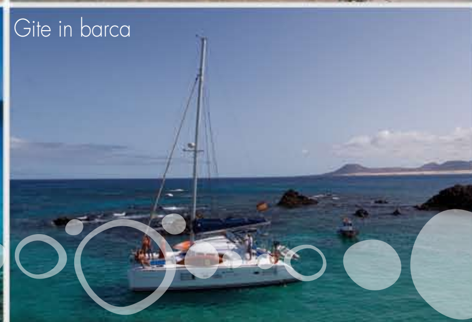
Gite in barca