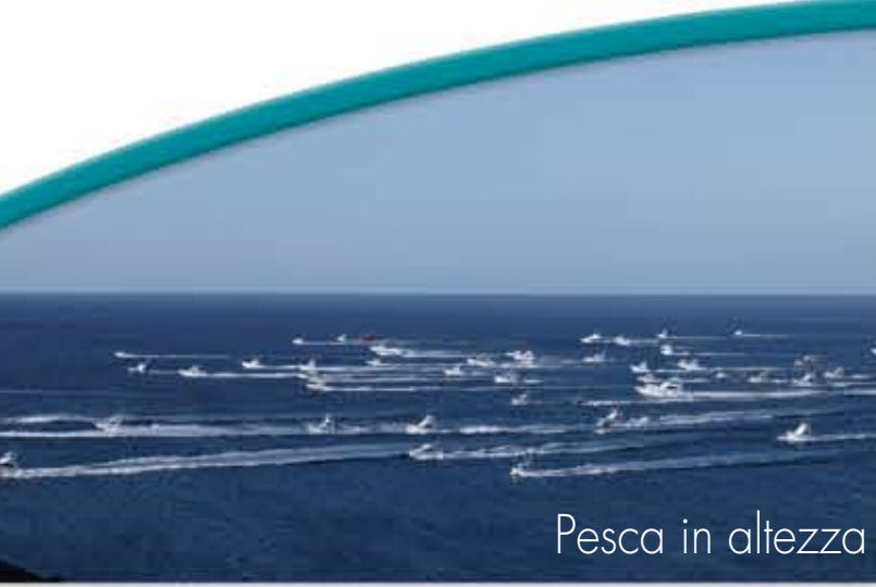
Pesca in altezza