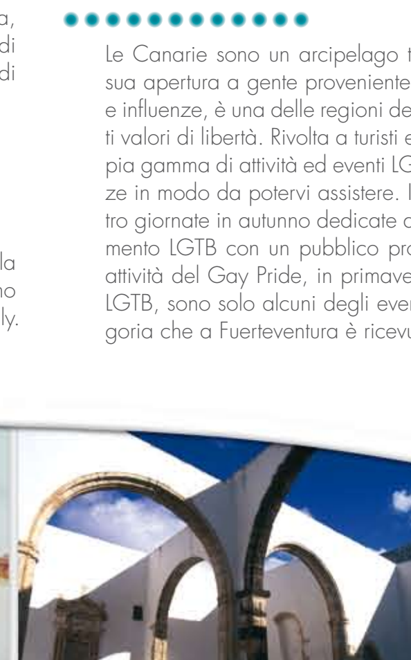
Convento di Betancuria