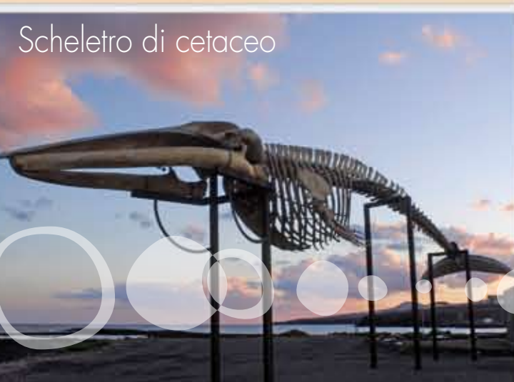
Scheletro di cetaceo