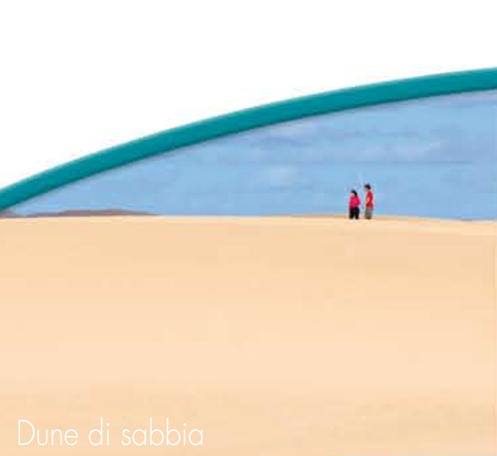
Dune di sabbia