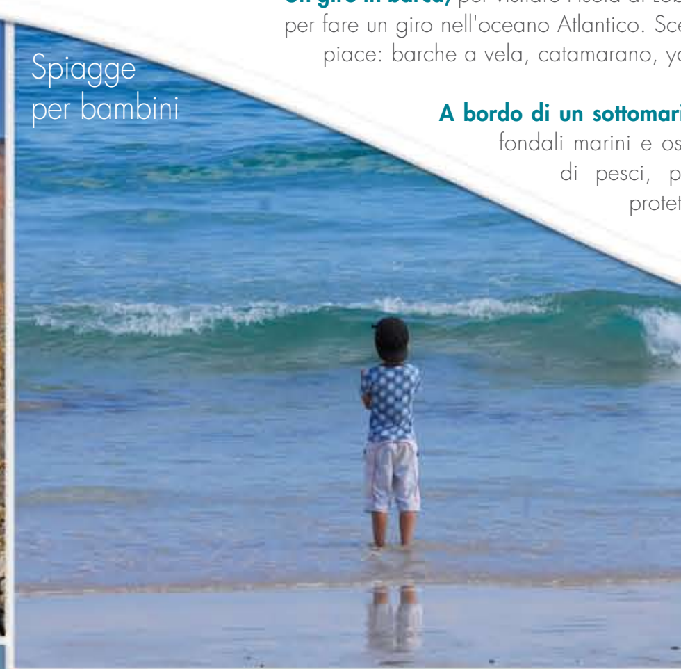
Spiagge per bambini