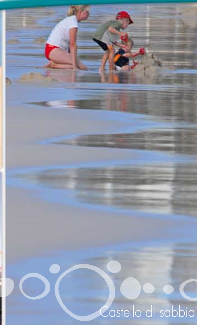
Castello di sabbia