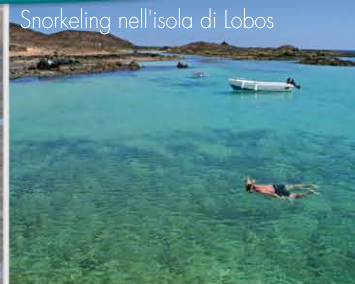
Snorkeling nell'isola di Lobos