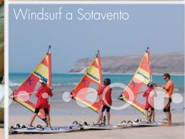
Windsurf a Sotavento