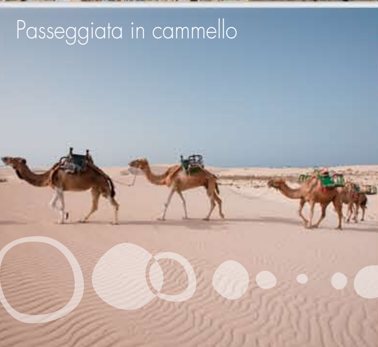
Passeggiata in cammello