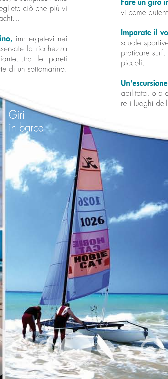
Giri in barca