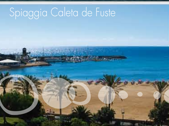
Spiaggia Caleta de Fuste