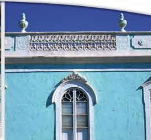
Facciata casa Antigua